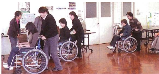
車イス体験をする参加者

域医療部、森ケアマネジャヤが「介護保険とボランティア」のテーマで行い、ゲーム感覚でのグループワークでは和気あいあいの中、時間を忘れての研修でした。