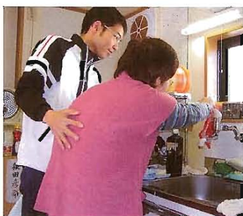
調理の動作に不安はないですか？

訪問リハビリは介護保険や医療保険を使って利用できます。詳しくは担当のケアマネジャーや当センターの介護保険室、医療相談室にお問い合わせ下さい。