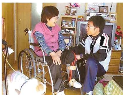
調子はいかがですか？

○はじめに 当センターには、在宅現場、通所現場で働く理学療法士、作業療法士、言語聴覚士が30名以上在籍し、自宅で生活する障がい者、高齢者、ご家族の支援を行っています。 近年、医療制度の変化に伴い、早期に在宅復帰する患者さんが増え、ますます在宅でのリハビリテーションは重要性を増しています。今回は、当センターの訪問リハビリテーションについてご紹介します。