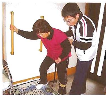
手すりを使った練習をしましょう