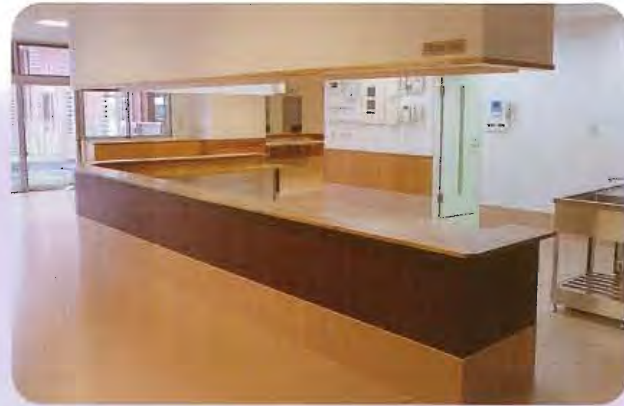
スタッフステーション