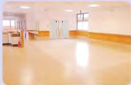
食堂兼共同生活室