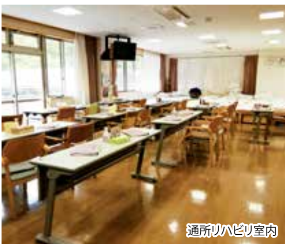
通所リハビリ室内

鹿教湯病院通所リハビリテーションは1999年9月の開設から鹿教湯病院中央棟2階で事業を行ってまいりました。この度の新病棟建て替えと同時に新たに敷地内に作る事が決まりましたが、工事期間中は三才山病院で事業を継続します。ご利用の皆様にはご不便をおかけ