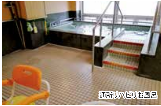
通所リハビリお風呂