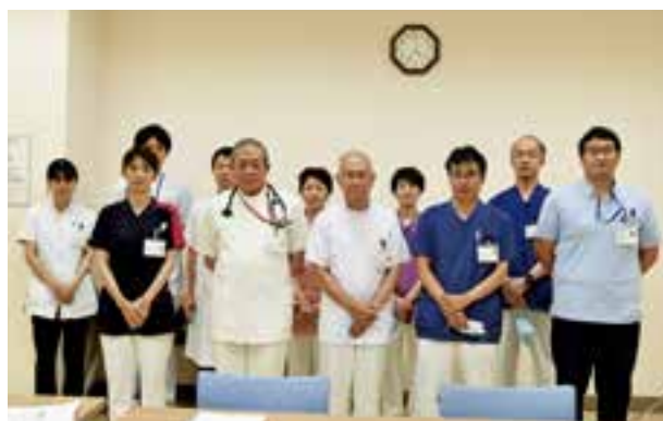
糖尿病サポートチーム