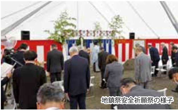
地鎮祭安全祈願祭の様子

した工事施行者の皆様と一緒に安全祈願をいたしました。この再編成工事は、地域医療構想調整会議を経て、鹿教湯病院と三才山病院が一つになることが承認された後、その器を造るため、鹿教湯病院の老朽化した建物を建替えるもので、令和六年十二月完成(予定)までの三年以上を要する大規模なものとなります。現地での建替えにより、仮設建物等を使用するため、鹿教湯病院をご利用頂く皆様には、ご不便をお掛けすることもあるかと存じますが、当センター職員一同、一丸となって地域医療に貢献できるよう努力して参りますので、ご理解、そしてお力添えを頂きます様、お願い申し上げます。