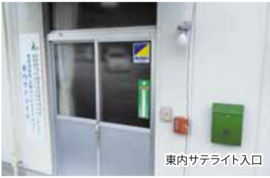
東内サテライト入口