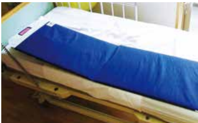
トランスファーボード

トランスファーボードは大型、中型、小型など大きさや特徴の異なるものを、対象者や状況に応じて使い分けています。入浴用スレットチャーに移乗する際には、臥床したまま移乗できる大型のボードを使用しています。素肌で乗っても痛みのないソフト素材で、濡れてもよい仕様になっています。ベッドからスレットチャー型車いす等へ移乗する際には中型のボードを、ベッド端坐位から普通型車いすへ移乗する際には小型のボードを使用しています。