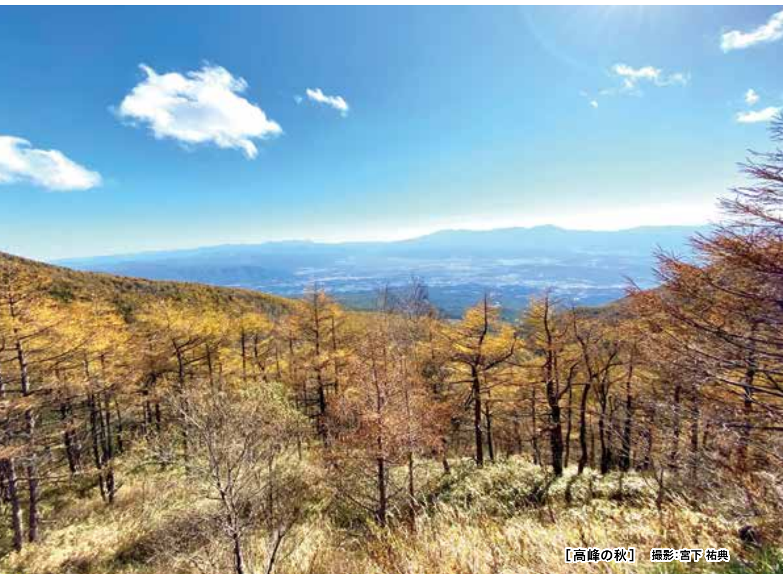
【高峰の秋】