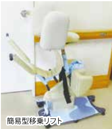
簡易型移乗リフト

スリングシートを用いずに座位から半立位の姿勢をとることができるリフトで、半立位姿勢の保持が無理なく行えるので、トイレ移乗の際には下衣の操作も合わせて行うことができます。また、全身の運動を補助してくれるため、ご本人の能力を活かしたケアを行うことができます。