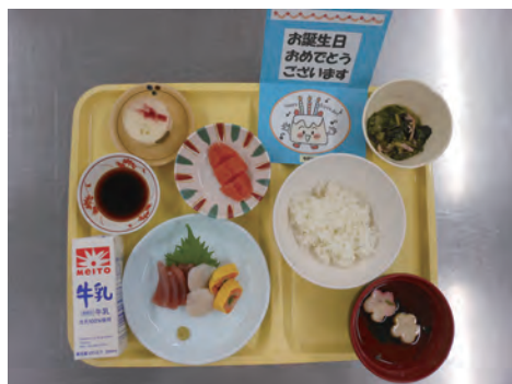
誕生日メニュー お刺身盛り合わせ