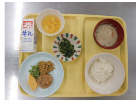
節分メニュー まぐろのナムル