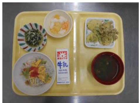
雑祭りメニュー ちらしずし 野菜の天ぷら