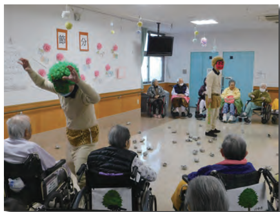
新聞を丸め、豆に見立てて鬼退治