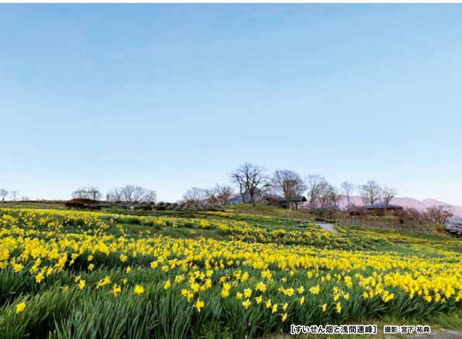
【すいせん畑と浅間連峰】