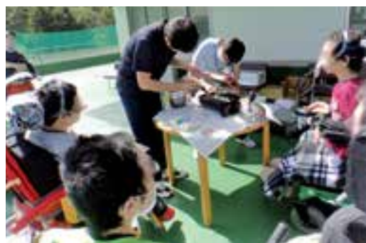
筋ジスの男子会「さんまを焼いて食べよう！」

現在は新型コロナウイルス対策で集団活動を制限せざるをえない状況です。重心のグループは体育館等で十分に換気をし、密にならないように配慮しながら行っています。筋ジスのグループは2年程活動を休止していましたが、最近各自のパソコンやタブレットを使用したZoomでの開催方法に切り替え、再開し始めています。コロナ禍であっても工夫しながら仲間とつながり、一緒に活動を楽しんでいきたいと思えます。