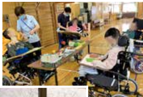
重心の男子会『「みさやま」の看板作り』