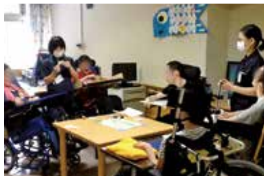
重心の男子会「すごろくゲーム」