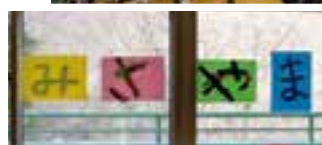
看板が完成しました！