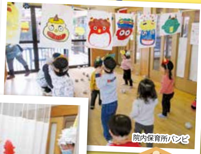
院内保育所バンビ