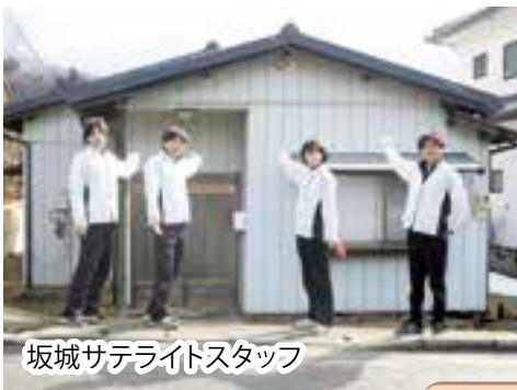
坂城サテライトスタッフ