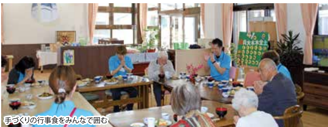
手づくりの行事食をみんなで囲む