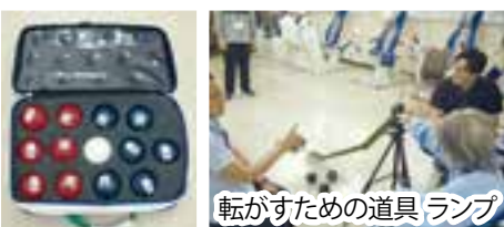
転がすための道具 ランプ