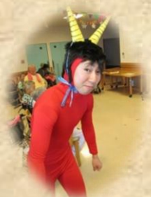
利用者さんに大人気! キュートな節分鬼