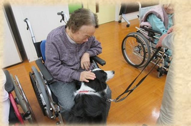
動物に会う事が楽しみになっています