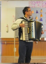
ひな祭りレクの ワンシーン

利用者さんに季節を感じてもらい、笑顔溢れる生活を送って頂けるよう、これからもスタッフみんなが工夫を凝らしていきたいと思えます。