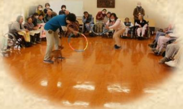
犬たちの芸に 歓声があがります

普段の施設生活では体験できないことであり、参加した利用者さんからは、昔飼われていた犬と重ね合わせ懐かしがられたり、犬を撫でようと手を伸ばされたりと、動物とのふれ合いを通して普段以上の笑顔が見受けられます。年3回、1回あたり20名程度の方に参加して頂いています。