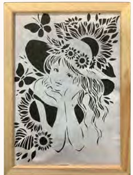
美少女 シュンコウサン様 孫娘もせめて可愛いと云われると良いが、 少し生意気になってきて心配である。