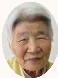
雑巾 けやき町 4つ折りにすると分厚くなるので 端が重ならないように縫いました