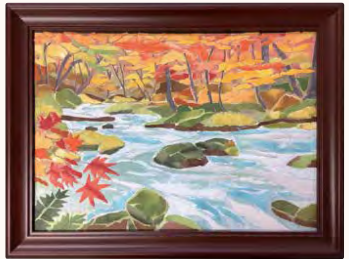
紅葉 H・K様 紅葉がきれいでお気に入りです