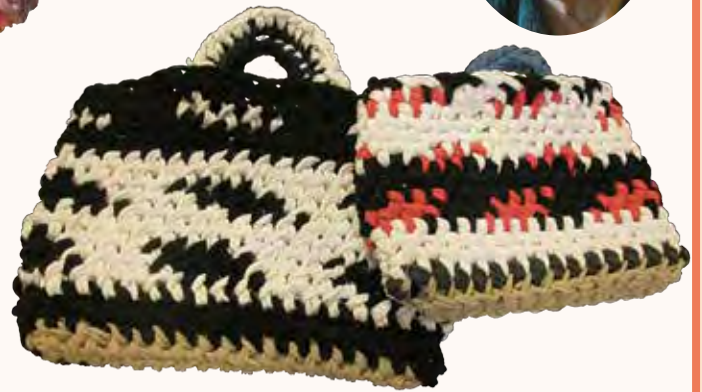
手提げバッグ さくら町 色合いを整えるのが大変でした