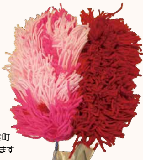
モップ けやき町 軽くて良いと思います