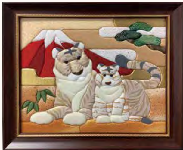
来年の干支 若林和子様 虎の目が難しかったです