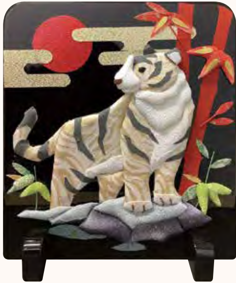
来年の干支 S・S様 布押絵は初めて作りました。 初めてにしては良く出来たかしら？