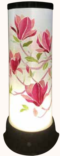
紅紫の木蓮 長谷川則夫様 葉の貼り付けが難しかった。