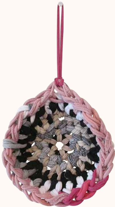
鍋敷き けやき町 S.I様 これで鍋焼きうどんでも食べたいです