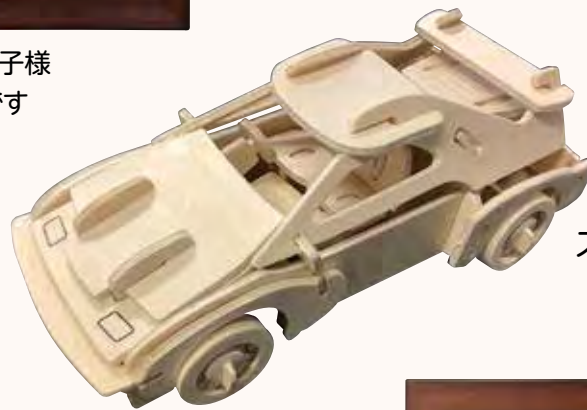
スーパーカー 小林明次様 女房と一緒に乗りたいです