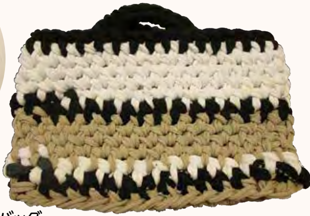
手提げバッグ けやき町 飯塚純子様 A4まで入ります 指が動かなくて少しずつ進めました