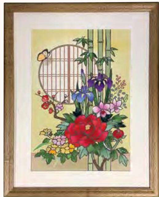
円窓の四季の花 岡崎郁子様 片手でも上手にできました!