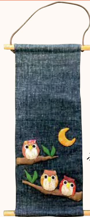
ふくろうの状差し Y・N様 使いやすい！