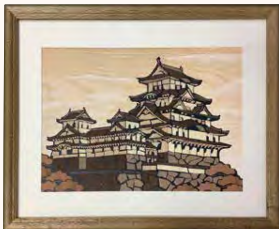
白鷺城 K・W様 細かすぎて難しかったです。