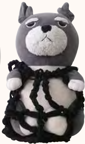
コロちゃんのゆりかご けやき町 児島貞子様 細かいところを編むのが大変でした