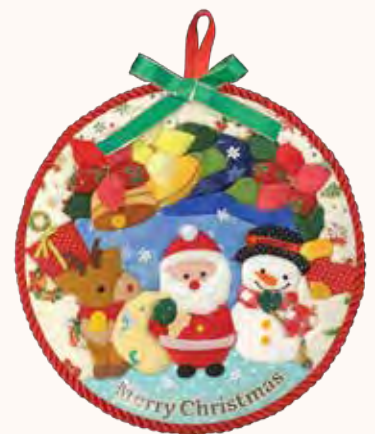
カントリースノーマン I・I様 難しかった。孫にあげようかな