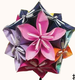
折り紙手芸 さくら町 清水つる子様 1枚1枚折るところが大変でした