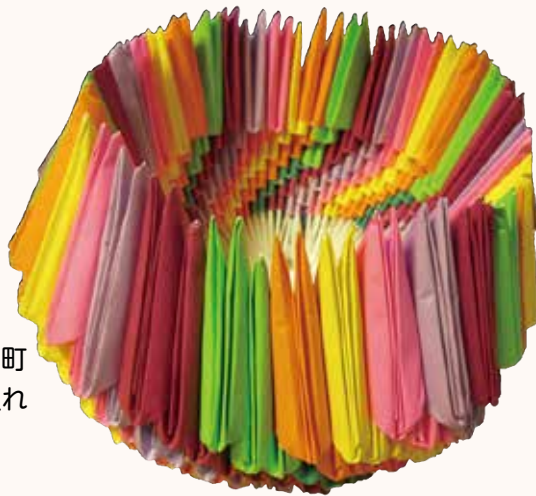
小物入れ さくら町 完成したら花瓶を入れ ようかと思います