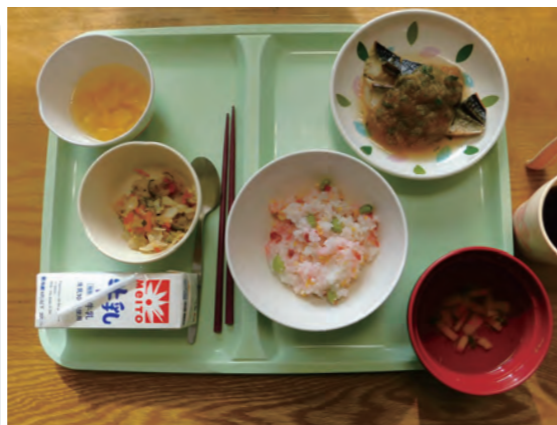
※お正月メニューの一例「梅ご飯」

当施設の食事は、その 時々の季節やイベントに 合わせた特別メニューを 提供しています。 今年のお正月には「赤 飯」や「ちらし寿司」「お雑 煮」等が振る舞われまし た。おいしい食事を利用 者さんは舌鼓を打ってい ました。