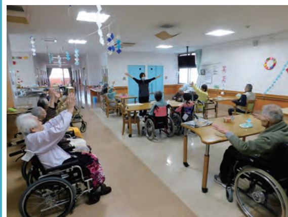
※ヘルスプロモーションの一場面 スタッフが声をかけながら、利用者 さんが集まって体操をしています。

当施設では毎日三十分程度のヘルス プロモーションを実施しています。ヘルス プロモーションとは「健康づくり」とい う意味で、自分らしく充実した生活を送 れるように健康面から支援する取り組み のことです。その一環として、筋力維持 を目的としたリハビリ体操やラジオ体操、 考えたり思い出すことで脳を活性化させ るクイズや回想法、楽しく体を動かして いただくために風船バレーや玉入れなど を行っています。 ヘルスプロモーションを通して利用者 さんの笑顔が見られ、お話を聞くことが でき、職員も嬉しく思っています。 これからもお互いが楽しめる「健康づ くり」を行っていきます。