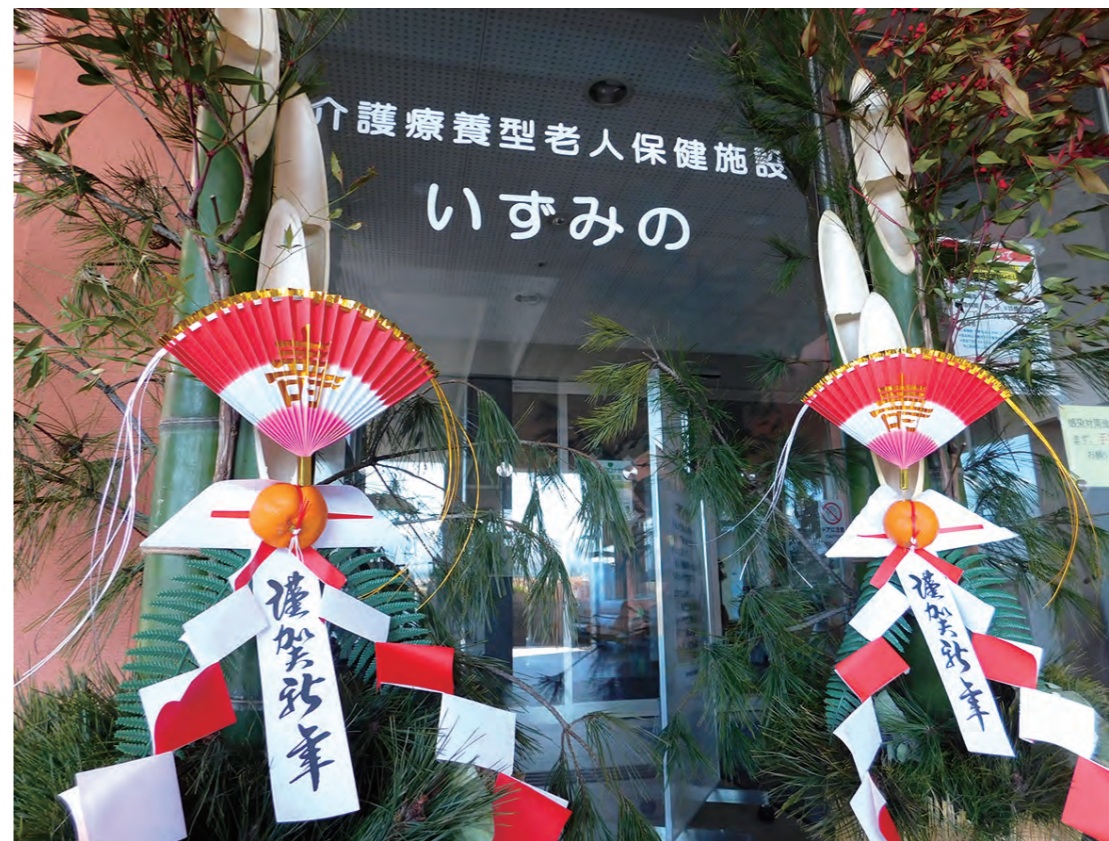
正面玄関には立派な門松が飾られました!!

入所階では新年会イベントを開催し、 利用者さんとスタッフ皆で新年をお祝いしました!