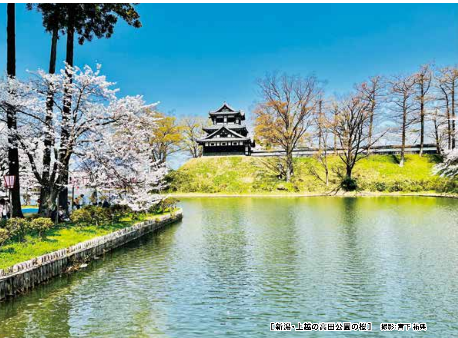
〔新潟・上越の高田公園の桜〕