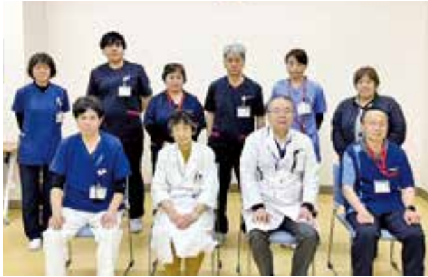
ICT(感染対策チーム)スタッフ

看護師5名(内感染管理認定看護師2名)、薬剤師2名、臨床検査技師2名、事務職員1名