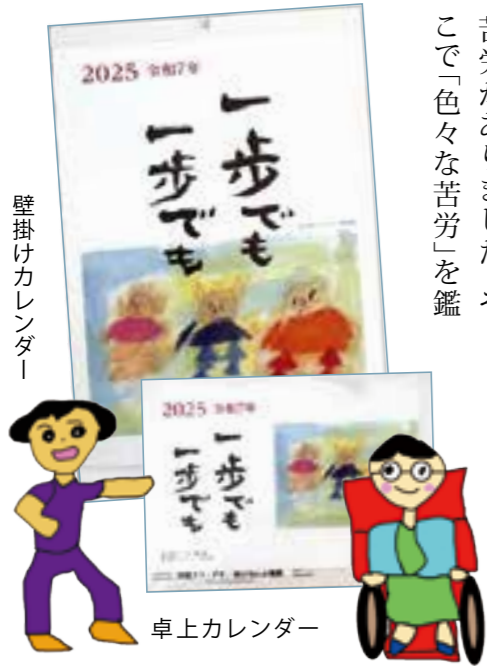
壁掛けカレンダー