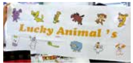
アニマル手ぬぐい