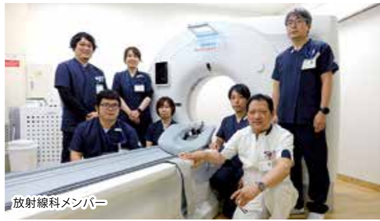
放射線科メンバー

また、人間ドック室内にトイレが設置され、快適な人間ドック受診が実現しました。新しい施設で、人間ドック受診いかがですか。