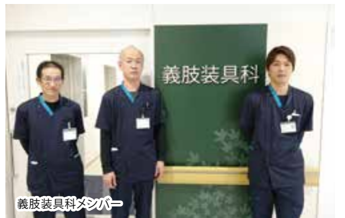
義肢装具科メンバー