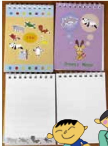
メモ帳 罫線あり・なし