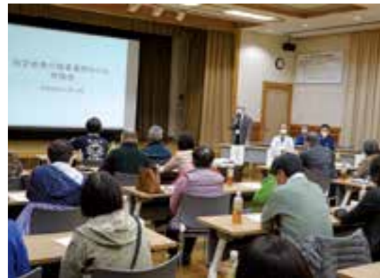
患者家族会の様子

11月23日、指定療養介護事業所「かりん」ご利用者様の家族会を開催し、33名のご参加を頂きました。まず「話そう 伝えよう 人生会議」として、医療ソーシャルワーカーによる学習会を行い、その後、家族会として日常の生活やリハビリテーションの様子説明、ご家族と職員による意見交換を行いました。ご家族のご意見をふまえつつ、適切なケアやサービスの提供ができるように努めてまいります。今後もご家族同士、またご家族と職員のコミュニケーションの場をつくってまいります。