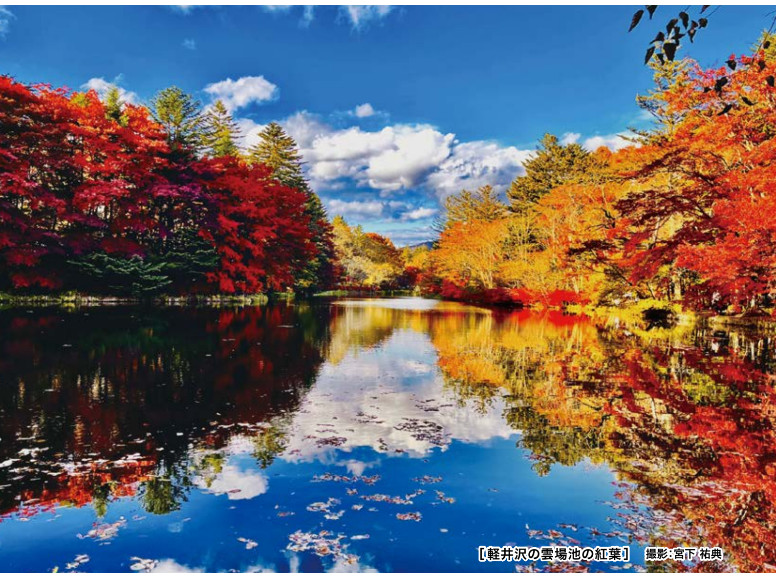
〔軽井沢の雲場池の紅葉〕