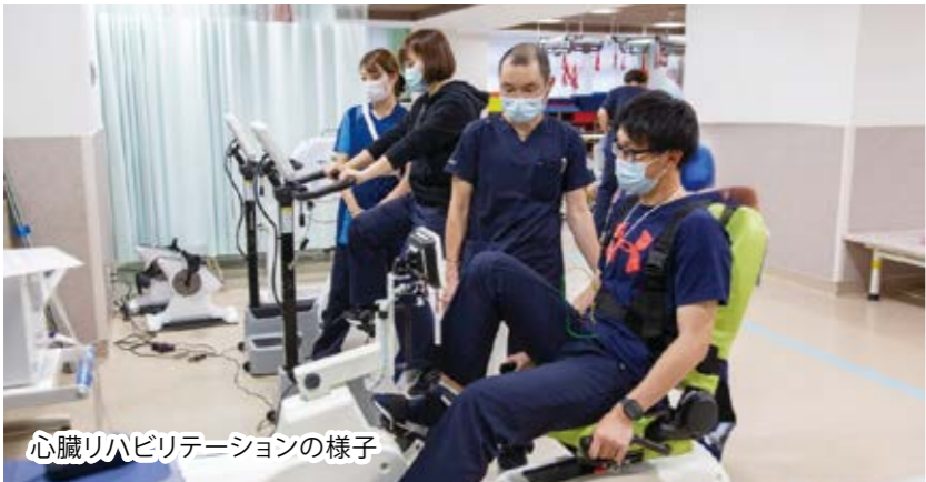
心臓リハビリテーションの様子