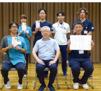
表彰式の様子 上位入賞者の皆さんと統括院長

長野厚生連では毎年(7月あたり)2日間(男子・女子)が試合を行います。参加チームは長野県厚生連病院の中の各事業所で構成されている部で、その