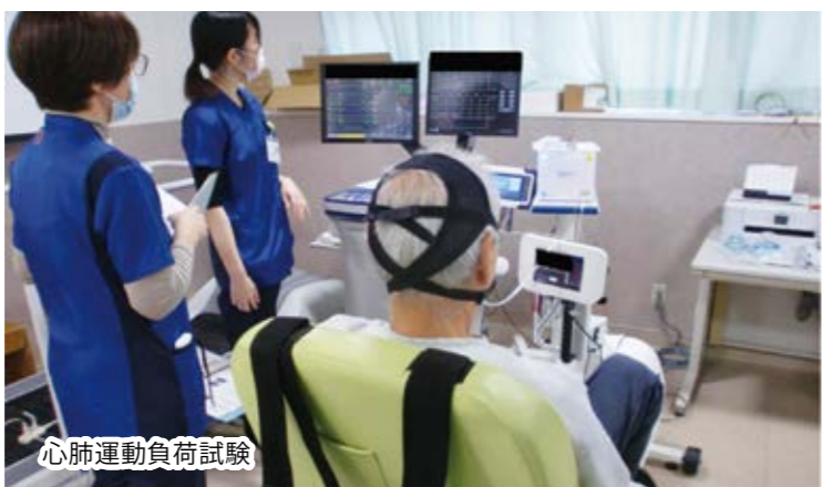
心肺運動負荷試験

疾患により、一定程度以上の呼吸循環機能の低下及び日常生活能力の低下を来している状態 (回復期リハビリテーション病棟は①のみ)